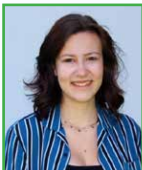
Jana Halwachs Wimmer Gymnasium